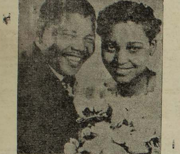
மண்டேலா - விவனி திருமணம் 1958 ஆம் ஆண்டு ஜூன் மாதம் 14-ஆம் திகதி நடந்தது. இந்தத் தம்பதிகள் 4 ஆண்டுகள் மட்டுமே சேர்ந்து இல்லறச் சிறையில் வாழ்ந்தார்கள். அதன் பின்னர் மண்டேலா அரசுச் சிறையில் வாழ்ந்து வருகின்றார். விவனி சிறைக்கு வெளியே போர்க்கொடியை உயர்த்திப் போராடுகிறார்.