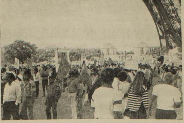
சமூகத்தமிழர் மீது கட்டவிழ்த்து விடப்பட்டிருக்கும் அடக்குமுறைகளைக் கண்டித்தும், தமிழர்களுக்கு ஆதரவு தெரிவித்தும் பாரிஸ் மாநகரில் நடைபெற்ற அமைதிப் பேரணியையே படத்தில் காண்கிறீர்கள். பிரான்ஸ் வாழ் சமூகத்தமிழர்கள் இப்பேரணியை ஒழுங்கு செய்து தெரிந்தனர்.

மையால் படகுகள் பழுதடைவதையும் அடிக்கடி சேவைகள் பாதிக்கப்படுவதையும் நாம் உணரமுடிகிறது. இச்சேவைக் கொள்கை அரசு ஆறு படகுகளை வழங்கிய போதும் உரிய பராமரிப்பு இன்மையால் உத்தரவாத மரிக்கப்பட்ட காலத்துக்கு முன்னதாகவே அவை சேவைக்கு வாய்க்கற்ற நிலைக்குத் தள்ளப்பட்டு விட்டன. தற்போது சேவையில் உள்ள ஒரேயொரு படகான குமுதனியும் அடிக்கடி பழுதடைவதால், தனியார் படகுகளில் நாம் மோசமான பயணங்களை மேற்கொள்ள வேண்டியிருக்கிறது. சில சமயம் கால்நடைகள், பொதிகள் என்பவற்றுடன் சேர்ந்து பிரயாணம் செய்ய வேண்டியவர்களாக இருக்கிறோம். ஆகவே பாதுகாப்பும் உறுதியும் நிறைந்தபுதிய படகுகளை விரைவில் சேவையில் ஈடுபடுத்துவதுடன் தனிநிர்வாகப்பிரிவு ஒன்றை ஏற்படுத்தவும் கோருகின்றோம்- எனக்குறிப்பிடப்பட்டுள்ளது. (உ-111)