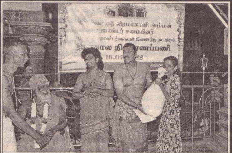
வண்ணை ஸ்ரீ வீரமாகாளி அம்மன் தொண்டர் சபையினர் மற்றும் கனடாவாழ் தொண்டர்கள் இணைந்து வறுமைக் கோட்டிற்கு உட்பட்ட நல்லூர் பிரதேச செயலகத்தினால் தெரிவு செய்யப்பட்ட 200 பயனாளிகளுக்கு நேற்று முன்தினம் 5000 ரூபாய் பெறுமதியான உலர் உணவுப் பொருட்கள் வழங்கி வைக்கப்பட்டன.

காலையில் வீட்டார் எழுந்தது மோட்டார் சைக்கிளை இயக்கிய போது மோட்டார் சைக்கிள் இயங்காத நிலையிலையே பெற்றோல் திருடப்பட்டமை தெரிய வந்துள்ளது. பின்னர் வீட்டில் பொருத்தியிருந்த பாதகாப்பு கண்காணிப்பு கமராவில் பரிசோதித்த போது, வீட்டினுள் அத்துமீறி நுழைந்த இருவர் மோட்டார் சைக்கிளில் பெற்றோலை திருடிக்கொண்டு சென்றமை தெரியவந்துள்ளது. (4-33)