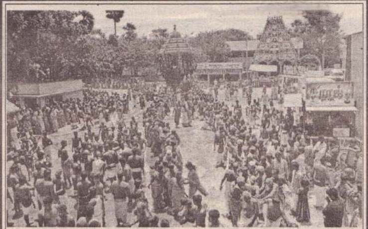
மாலை சந்தையான் ஸ்ரீ வரதராஜ விநாயகர் ஆலய தேர்த்திருவிழா நேற்று முன்தினம் பெருந்திரளான பக்தர்களுடன் பக்தி பூர்வமாக இடம்பெற்றது.

வடக்கு-கிழக்கு தமிழர் பகுதியில் எமது இளைஞர், யுவதிகளுக்கு அதிகமான வேலை வாய்ப்பைப் பெற்றுக் கொடுப்பதற்கு ஏற்றவகையில் பெரியளவிலான தொழிற்சாலைகளை விரைவில் நிறுவுவதற்கான நடவடிக்கையை எடுக்க வேண்டும். நீண்ட காலமாக நடாத்தப்படாமல் இருக்கும் மாகாணசபை தேர்தலை உடனடியாக நடாத்துவதற்கான நடவடிக்கைகளை மேற்கொள்ள வேண்டும். உள்ளிட்ட 10 அம்ச கோரிக்கைகளை இலங்கை அரசிடம் இருந்து எழுத்து மூலமான உத்தரவை அனைத்து தமிழ்க் கட்சிகளும் பெற்றுக்கொள்ள வேண்டும். தொடர்ந்து இலங்கை அரசின் வாய்மூல உத்தரவுகளை நம்பி ஏமாறும் போக்கிற்கு அனைத்து தமிழ்க் கட்சியினரும் முற்றுப்புள்ளி வைக்க வேண்டும் எனவும் அவர் மேலும் தெரிவித்தார். (4-6-18-33-60)