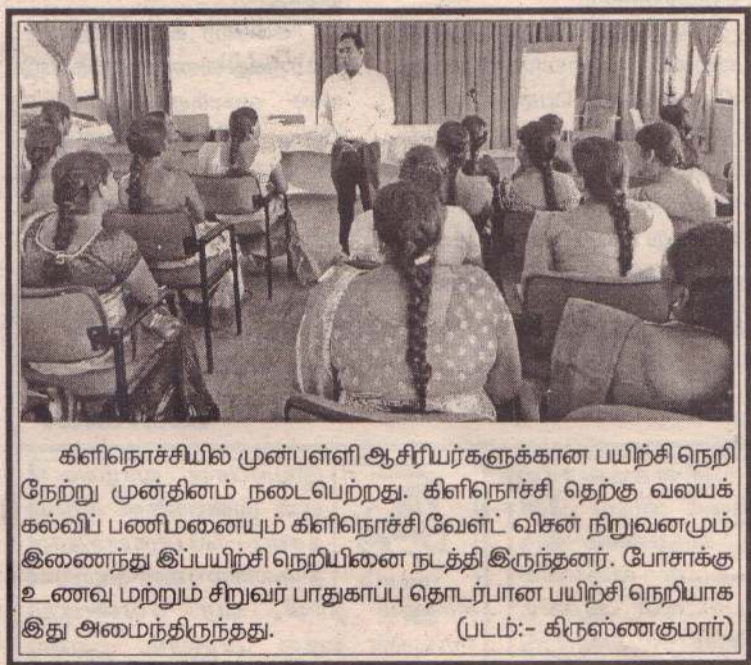
கிளிநொச்சியில் முன்பள்ளி ஆசிரியர்களுக்கான பயிற்சி நெறி நேற்று முன்தினம் நடைபெற்றது. கிளிநொச்சி தெற்கு வலயக் கல்விப் பணிமனையும் கிளிநொச்சி வேள்த விசன் நிறுவனமும் இணைந்து இப்பயிற்சி நெறியினை நடத்தி இருந்தனர். போசாக்கு உணவு மற்றும் சிறுவர் பாதுகாப்பு தொடர்பான பயிற்சி நெறியாக இது அமைந்திருந்தது.

என்பதை தகவல் மற்றும் தொடர்பாடல் தொழில்நுட்ப முகவர் நிறுவனம் (ICTA) பொது மக்களுக்கு அறிவித்துள்ளது. இதேவேளை தனிப்பட்ட தகவல்களை சேகரிக்கும் முயற்சியில் ஈடுபட்டுள்ள அங்கீகரிக்கப்படாத இணைய தளங்கள் தொடர்பான தகவல்கள் கிடைத்துள்ளன. இதனால் இது குறித்து பொது மக்கள் விழிப்புடன் இருக்குமாறு கேட்டுக்கொள்கிறோம் என்று அந்த அறிவிப்பில் குறிப்பிட்டுள்ளது. (4-6)