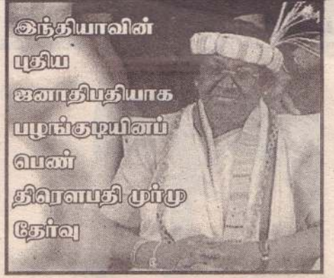
இந்தியாவின் புதிய ஜனாதிபதியாக பழங்குடியினப் வயன் திரௌபதி முர்மு தேர்வு