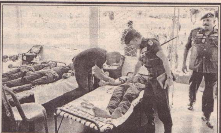
தேசிய மாணவர் படையணியின் இருபதாவது படைப்பிரிவின் 11 ஆவது ஆண்டு நிறைவு விழாவை முன்னிட்டு நேற்று முன்தினம் புதன் கிழமை இரத்த தான முகாம் ஒழுங்கு செய்யப்பட்டது. இந்நிகழ்வில் 511 ஆவது, 512 ஆவது படைப்பிரிவு, 51 ஆவது காலாட் படையணி ஆகியவற்றின் சிவில் ஒழுங்கமைப்பு அதிகாரிகள், படைப்பிரிவின் அதிகாரிகள், மாணவச் சிப்பாய்கள், நலன் புரிகள், பழைய மாணவ சிப்பாய்கள் என 100 பேர் இரத்த தானம் செய்தனர்.

பாராளுமன்றத்தில் நேற்று முன்தினம் இடம்பெற்ற இரகசிய வாக்கெடுப்பின் போது இலங்கையின் 8 ஆவது நிறைவேற்று ஜனாதிபதியாக ரணில் விக்கிரமசிங்க தெரிவு செய்யப்பட்டார். பொது மக்களின் விருப்பத்திற்கு மாறாக ஜனாதிபதி நியமனம் செய்யப்பட்டுள்ளதால் அவர் பதவி விலக வலியுறுத்தி அமைதியான முறையில் போராட்டம் தொடரும் எனவும் காலிமுகத்திடல் போராட்டக்காரர்கள் தெரிவித்துள்ளனர். (4-6)