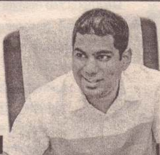
(11 ஆம் பக்கம் பார்க்க)