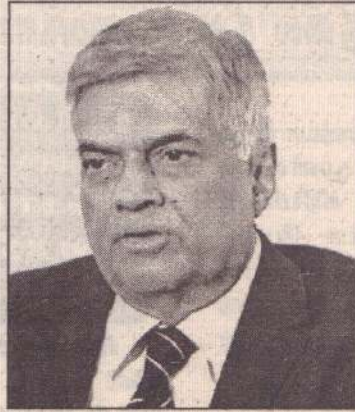
கனோ அன்றைக்கே போராட்டம் நீர்த்துப் போய்விட்டது. அமைதி வழியில் ஆரம்பித்த போராட்டம் கடைசியில் வன்முறை காரணமாக தோல்விடைந்து விட்டது என்றும் ரணில் விக்கிரமசிங்க சுட்டிக்காட்டியுள்ளார். (4)

போராட்டக்களங்கள் அறவழிப் போராட்டங்களாக, வன்முறை தவிர்ப்பு போராட்டமாக இருந்த நிலையில் அரசியல்வாதிகள் மற்றும் பொதுமக்களின் ஆதரவு கிடைத்தது. பாதுகாப்புத் தரப்பினரும் அவ்வாறான அமைதிப் போராட்டங்களை அடக்க தயக்கம் காட்டினர். ஆனால் ஜனாதிபதி மானிகை மற்றும் ஏனைய அரசு கட்டடங்களை கைப்பற்றவும் அரசாங்கத்தின் செயற்பாடுகளுக்கு இடையூறு ஏற்படுத்தவும் போராட்டக்காரர்கள் என்றைக்கு வன்முறையை நாடத் தொடங்கினார்