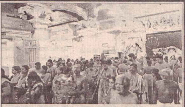
வண்ணையம்பதி ஸ்ரீ வேங்கடவரதராஜப்பெருமாள் ஆலயத்தில் வரலட்சுமி விரத உற்சவம் நேற்று காலை சிறப்பாக இடம்பெற்றது. பின்னர் வரலட்சுமி நூல்காப்பும் பக்தர்களுக்கு சிவாச்சாரியார்கள் வழங்கி வைத்தனர்.

(கரணவாய்) நெல்லியடி பொலிஸ் பிரிவுக்குட்பட்ட வெட்டுக்கான் பகுதியில் மூன்று பவுண் நகை களவாடப்பட்டுள்ளது. கரணவாய் தெற்கு, வெட்டுக்கான் பகுதியிலுள்ள வீடு ஒன்றிலேயே நேற்று முன்தினம் வியாழக்கிழமை காலை இச்சம்பவம் இடம் பெற்றுள்ளது. வீட்டில் இருந்தவர்கள் வெளியே சென்ற சமயம் அதனை சாதகமாக பயன்படுத்தி வீடு உடைக்கப்பட்டு அங்கிருந்த ஒன்றரை பவுண் தங்கச் சங்கிலி மற்றும் அரைப்பவுண் நிறையுடைய மூன்று மோதிரங்கள் களவாடப்பட்டுள்ளன. குறித்த திருட்டு தொடர்பில் நெல்லியடிப் பொலிஸ் நிலையத்தில் முறைப்பாடு செய்யப்பட்டுள்ளது. (4-6-60)