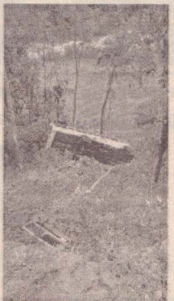
லணைகளை மேற்கொண்டு வருகின்றனர். (4)

இந்த விபத்தில் ஒருவர் உயிரிழந்துள்ளதடன், 13 பேர் படுகாயங்களுக்குள்ளாகியுள்ளனர். குறித்த வீதியானது வழக்கல் தன்மையுடன் காணப்பட்டது காரணமாக பேருந்தின் சாரதிக்கு பேருந்தை கட்டுப்படுத்த முடியாமல் போனமையே விபத்துக்குக் காரணம் என ஆரம்பகட்ட விசாரணையில் தெரியவந்துள்ளது. இவ்விபத்து தொடர்பாக பூண்டூலோயா போக்குவரத்து பொலிஸார் மேலதிக விசார