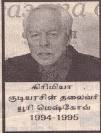
கிரிமியா குடியரசின் தலைவர் யூரி மெஷ்கோவ் 1994-1995

ரஷ்ய சார்பு யூரி மெஷ்கோவ் இரண்டாவது சுற்று வாக்கெடுப்பில் 72.9 சதவீத வாக்குகளுடன் வெற்றி பெற்றார். வேறு சில வேட்பாளர்களும் ஜனாதிபதி தேர்தலில் போட்டியிட்டனர்.