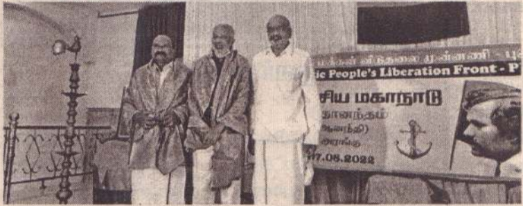
(யாழ்ப்பாணம்) முன்னணியின் பத்தாவது தேசிய மாநாடு நேற்று ஞாயிற்றுக்

கிழமை யாழ்ப்பாணம் நாச்சிமார் கோவிலடியில் உள்ள ராஜா தனியார் மண்டபத்தின் சதானந்தம் அரங்கில் இடம்பெற்றது. இதன்போது மங்கள விளக்கேற்றப்பட்டதுடன் புளொட்டின் செயலதிபர் உமாமகேஸ்வரனின் உருவப்படத்திற்கு மலர் மாலை அணிவிக்கப்பட்டு நிகழ்வு ஆரம்பமாகி நடைபெற்றது. மாநாட்டில் பிறகட்சித் தலைவர்களும் கலந்து கொண்டதுடன் புளொட் அமைப்பின் ஆரம்பகால உறுப்பினர்கள் உள்ளிட்ட பலர் கலந்துகொண்டனர். (4-33)