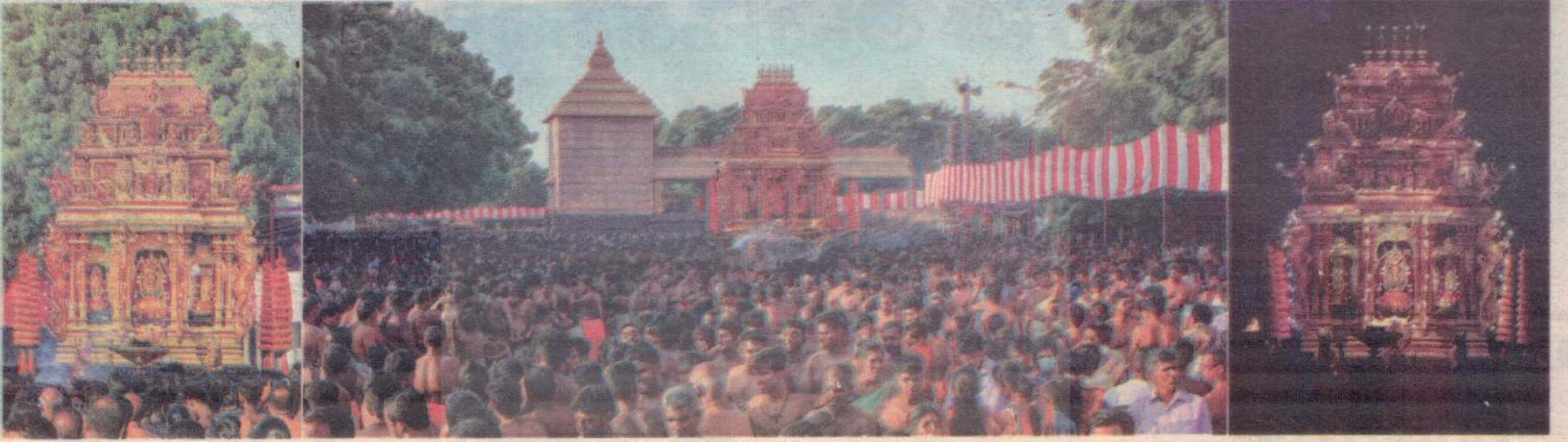
வரலாற்றுச் சிறப்பு மிக்க நல்லூர் கந்தசுவாமி ஆலயத்தின் வருடாந்தப் பெருந்திருவிழாவின் 10ஆம் நாளான நேற்று மஞ்சத் திருவிழா நடைபெற்றது. பல்லாயிரக்கணக்கான பக்தர்கள் கலந்துகொண்டனர்.