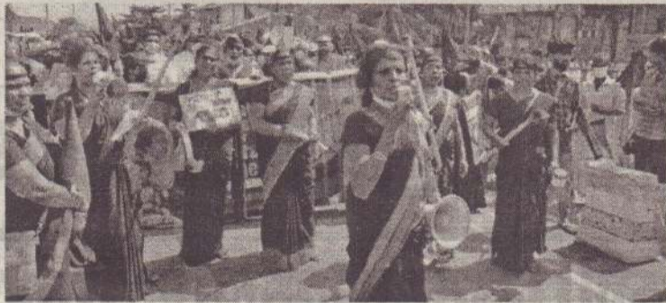
சபையின் மனித உரிமை ஆணையகத்திற்கு மகஜர் ஒன்

சர்வதேச விசாரணையை வலியுறுத்தி முன்னெடுக்கப்பட்ட போராட்டத்தில் ஐக்கிய நாடுகள்