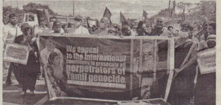
றினையும் அவர்கள் நேற்று அனுப்பி வைத்தனர்.

காணாமல் ஆக்கப்பட்ட தமது உறவுகளை மீட்டுத் தருமாறும் அவர்களுக்கு என்ன நடந்தது என்பது தொடர்பிலும் நீதியான விசாரணை வேண்டும் என்பதை வலியுறுத்தியும் கோட்டாபய அரசினையும், மகிந்த ராஜபக்ஷ அரசினையும், அவர்களது குடும்பத்தினரையும் கைது செய்து நீதியின் முன் நிறுத்துமாறும் இதன்போது வலிந்து காணாமல் ஆக்கப்பட்ட