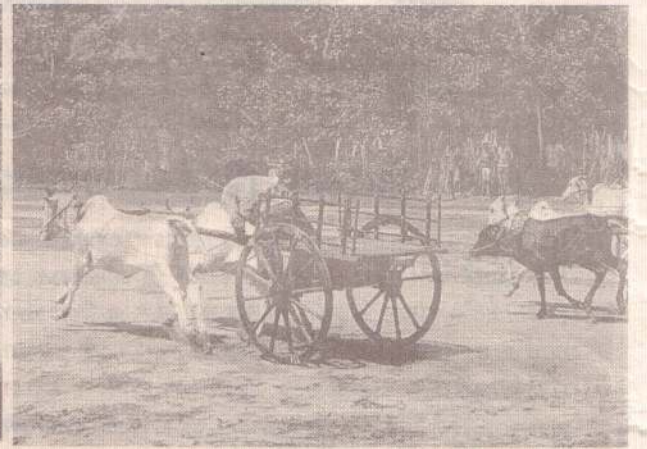
கிளிநொச்சி மக்கள் அமைப்பின் ஏற்பாட்டில், வட்டக்கச்சி சில்வா வீதியில் அமைந்துள்ள கலைவாணி சவாரித்திடலில் நேற்றுமுன்தினம் மாட்டுவண்டிச் சவாரிப்போட்டி இடம்பெற்றது. போட்டியில் கிளிநொச்சி, முல்லைத்தீவு, மன்னார், யாழ்ப்பாணம் ஆகிய மாவட்டங்களைச் சேர்ந்த பல போட்டியாளர்கள் கலந்துகொண்டனர். (ம-14,113)