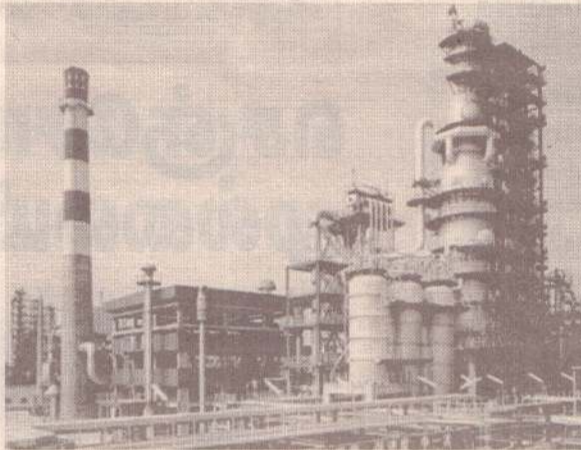
சுத்திகரிப்பு நிலையப் பணிகள் மீண்டும் ஆரம்பமாகின்றன என அமைச்சர் மேலும் தெரிவித்துள்ளார். (ச-இ)

தொன் மசகு எண்ணெய் தாங்கிய மற்றொரு கப்பல் எதிர்வரும் 23ஆம் திகதி முதல் 29ஆம் திகதிக்குள் நாட்டை வந்தடையவுள்ளது என்றும் அறிவிக்கப்பட்டுள்ளது. இந்த நிலையிலேயே சபுகஸ்கந்த எண்ணெய்