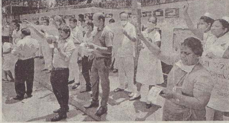
நிலைமைக்கு விரைவான தீர்வைக் கோரியும் இந்த ஆர்ப்பாட்டம் முன்னெடுக்கப்பட்டது. (நி)

(கொழும்பு) அரசாங்கத்திற்கு எதிராக சுகாதாரத்துறை ஊழியர்களின் எதிர்ப்பு ஆர்ப்பாட்டம் இலங்கை தேசிய மருத்துவமனைக்கு முன்பாக நேற்று நடைபெற்றது. சுகாதார சங்கத்தின் ஊழியர்கள் அனைவரும் இந்த எதிர்ப்பு ஆர்ப்பாட்டத்தில் கலந்து கொண்டனர். சுகாதாரத்துறையில் மருந்து மற்றும் மருத்துவ உபகரணங்களுக்கு நிலவும் தட்டுப்பாடுகளுக்கும் நாட்டின் நெருக்கடி