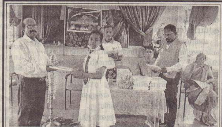
செஞ்சிலுவைச் சங்கம் மூலம் நடத்தப்பட்ட விசேட பயிற்சியில் தெரிவுசெய்யப்பட்ட மாணவர்களுக்கு பரிசீலகர் வழங்கும் நிகழ்வு நேற்று யா/ நெல்லியடி மெ.மி.த.க. பாடசாலையில் இடம்பெற்றது.

12 வருடங்கள் கடந்துள்ள நிலையில் அதன் ப்ராமரிப்புப் பணிகள் சீன பொறியியலாளர்களால் மாத்திரம் மேற்கொள்ளப்படுவதாக தெரிவிக்கப்படுகிறது. (4)