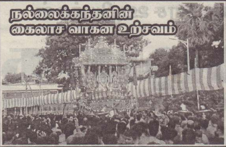
நல்லைக்கந்தனின் கைலாச வாகன உற்சவம்

மஹாசங்கத்தினர் பிரித்த பாராயணம் செய்து ஜனாதிபதிக்கு ஆசி வழங்கிய துடன், ஜனாதிபதி ரணில் விக்கிரமசிங்க அவர்களுக்கு "மிஹிந்தலா நினைவுச் சின்னமுடி" வழங்கிவைக்கப்பட்டது. (ம-7)