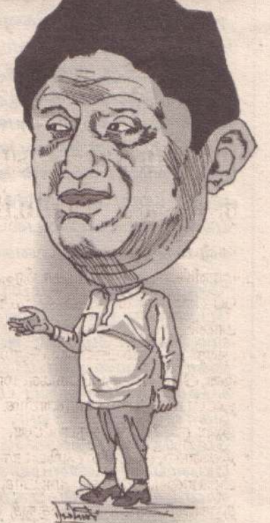
ஆட்சியைக் கைப்பற்றியவர்கள் இந்த முயற்சிகளில் தீவிரம் காட்டுகின்றனர் -என்றார். (ம)

அனைத்து மக்களும் ஓரணியில் நின்று விரட்டியடித்த ராஜபக்சக் களை மீண்டும் களத்துக்குக் கொண்டுவருவதற்கான முனைப்புகள் தற்போது இடம்பெறுகின்றன. ராஜபக்சக்களின் துணையுடன்