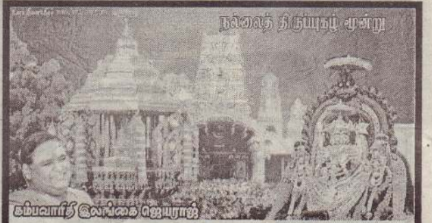
கம்பவாரிதி இலங்கை ஜெயராஜ்

Digitized by Noolaham Foundation. noolaham.org | aavanaham.org சரவணன் செல்வன், பிளவத்தை.