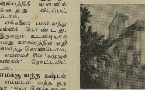
இராணுவத் தாக்குதலில் சேதமடைந்த வல்வை சென். செபஸ்தியார் தேவாலயம்.

கொண்டிருந்தார். நாம் அதனைத் தொடர்ந்து கொண்டிருந்தோம். சாவகச்சேரி, கொடிகாமம் தாண்டி முள்ளிப்பகுதியை செஞ்சிலுவை வாகனம் அணிமீத்த பொழுது நேரம் இரண்டு மணி இருக்கும். வீதியில் குறுக்கே பண்டமரங்கள் போல் படபடத்து இருந்தன. கையில் ஆயுதங்களுடன் போராளிகள் நிற்கிறார்கள். எமது வாகனம் தொடர்ந்து சென்று கொண்டிருந்தது. திடீரென இராணுவச்