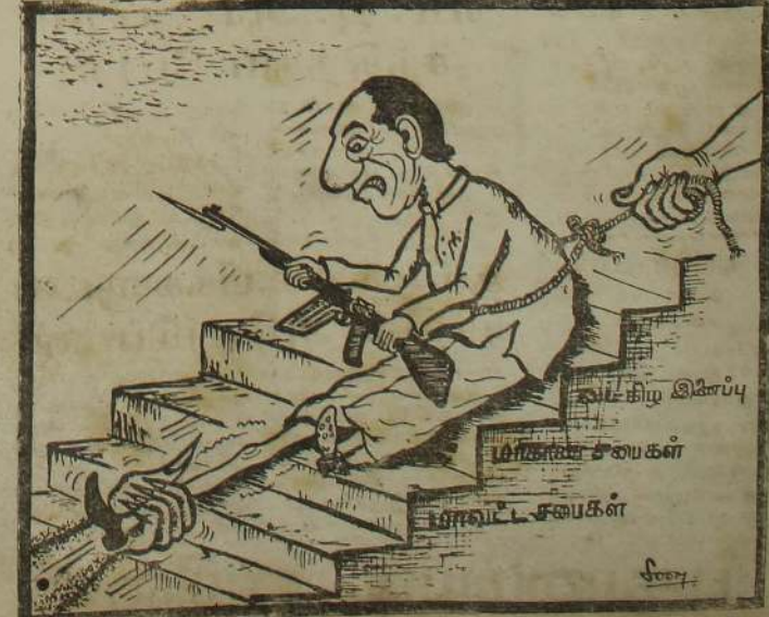
வெங்கட்ராமன் மாணிக்கையில் வைக்கப்பட்டுள்ளது என்பதை உணரமுடிகின்றது.