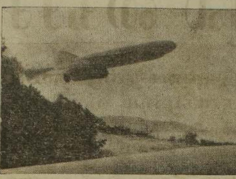
இக்கப்பலைத் தாக்கியது. அமெரிக்காவை குவாவத் இத்தாக்குதலில் 37 அமெரிக்க வீரர்கள் அப்பொழுது அமெரிக்கா வரையில் சேர்ந்தது.

மத்திய கிழக்கில் ஏனைய அரபு நாடுகளின் குறிக்கோள் ஆகும். ஷியா முஸ்லிம்களைப் பெரும்பான்மையாகக் கொண்ட சராக்கின் வளைகுடா யுத்தத்தில் வெற்றி பெறுவதை தடுக்கும் முயற்சியாகவே இது கருதப்படுகிறது.