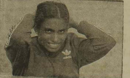
★ வீராங்கனை உஷா ★ சோபிக்கமுடியவில்லை. ஆனாலும் 1984 லொன் ஏதூசல் ஒலிம்பிக்கில் சாதனைக்கமுடியுள்ளது என்று அறிவித்தவசமாக .01 செக்கனில் 400 மீற்றர் ஏரியாட்டில் 4 தங்கப் பதக்கங்களையும் 1 வெள்ளிப் பதக்கத்தையும் வென்று அடுத்த ஆண்டு ரோவில் நடைபெறவுள்ள ஒலிம்பிக்கில் தன்னுடைய

பேட்டியில் இருக்கும் மற்றைய வீராங்கனைகளுக்கு அறை சுவல் விடுத்துள்ளார். அடுத்த ஒலிம்பிக்கில் எப்படியும் ஒரு பதக்கத்தைப் பெறவுது என்று முயன்றுவரும் உஷா தன்னுடைய பிரியமான 400 மீற்றர் தடைதான்டில் தொடர்ந்து வெற்றிபெற்றுவருகின்ற போதும் ஒட்ட நேரம் அதிகமாகிவருவதை கண்க்கொள்ள வேண்டும். அல்லதுபோனால் அடுத்தவரும் ஒலிம்பிக்கிலும் வெற்றிபெறவுது அசாத்தியமாகிவிடும.