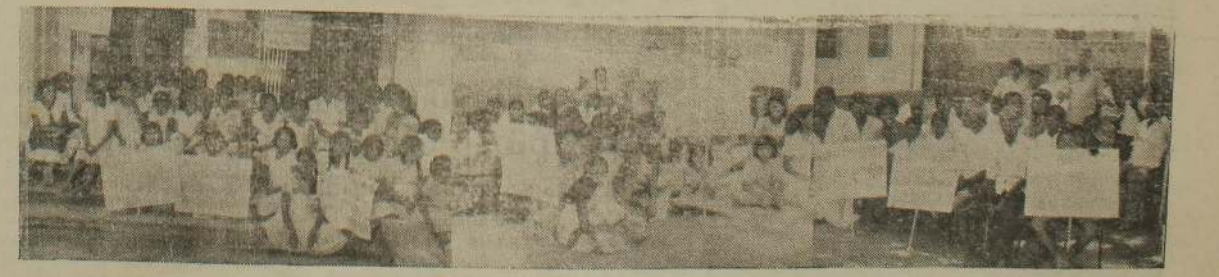
இந்திய அரசு தமிழ் போராளிகள் மீது நிர்ப்பந்தம் செலுத்துவதை எதிர்த்து நேற்று திருநெல்வேலி இந்து வாரிசர் சங்கக் கூட்டம், கலட்டி பெரியதம்பிரான் ஆலயம் ஆகியவற்றின் முன்னால் பொதுமக்கள் உண்ணாவிரதம் அனுஷ்டித்த

யாழ்ப்பாணம், ஜூலை 30 தமிழீழ விடுதலைப் புலிகளின் தலைவர் வே. பிரபாகரன் மீது இந்திய அரசு இராஜதந்திர நெருக்குதல் மேற்கொண்டு வருவதாகப் புலிகள் நேற்று விடுத்த அறிக்கை ஒன்றில் தெரிவித்துள்ளனர். அந்த அறிக்கையில் மேலும் தெரிவிக்கப்பட்டிருப்பதாவது:— தலைவர் பிரபா தமிழீழ மக்களின் இலட்சியத்திலிருந்து சிறிதளவும் பின்வாங்காது உறுதியாக இருந்து வருவதைத் தொடர்ந்து இந்திய அரசு அவர்மீது மிகவும் கடுமையான இராஜதந்திர நெருக்குதல் மேற்கொண்டுள்ளது. இத்தகைய ஒரு நெருக்குதல் சூழ்நிலையில் தலைவர் கருத்துக்கள் தொடர்பாக பத்திரிகைகள், வாடொலி உட்பட வெகுஜனத் தொடர்பு சாதனங்கள் வெளியிடும் கருத்துக்களை தமிழீழ மக்கள் நம்ப வேண்டாம் (4 ஆம் பக்கம் பார்க்க)