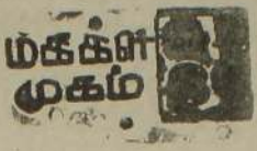
மக்கள் முகம் வள்ளுவர் சனசமூக நிலையம்

வித்தியாலய வளர்ச்சிக்கு ஆணிவேராக இருந்தவர் பிரியாவிடை வைபத்தில் உரை