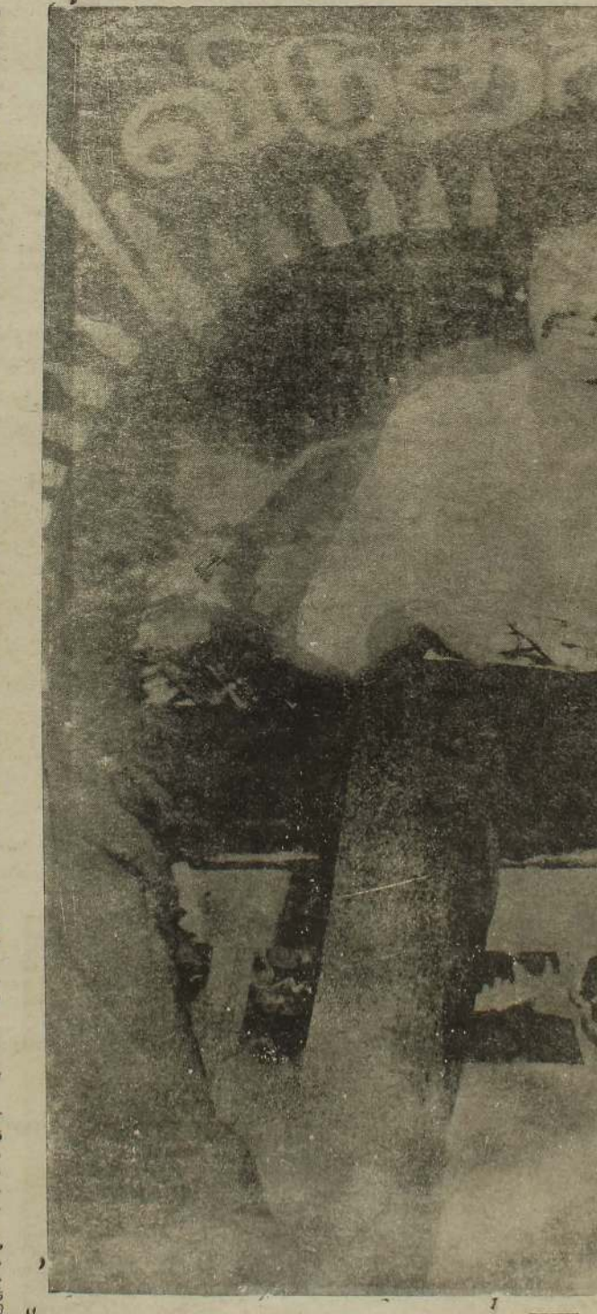
"மக்கள் பாட்சி வெடிக்கட்டுந் தமிழ்நாற் மலரட்டுந்" - நான் சித்தி எஸ். குமார், டி. வி. வேல்வரன், (9-8)