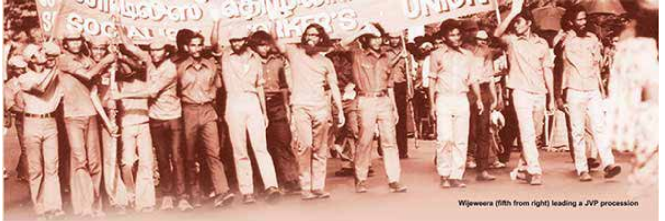
Wijeweera (fifth from right) leading a JVP procession

விஜேவீர அவர் கட்சியில் இருந்தார். கட்சியின் நியமனத்துக்கு உழைத்தார். தனது தேர்தல் பிரச்சாரத்திற்காகத் தமிழ் மக்கள் தனக்கு வாக்களிக்க வேண்டும் என்று கூறி பெருமளவிலான தேர்தல் சுவராட்டிகளும், துண்டு பிரசாரங்களும் அச்சடித்து பணத்தை விரயம் பண்ணி, தமிழ் மக்கள் தமிழராகத் தனக்கு வாக்களிக்க வேண்டும் என்ற இனப்பிரச்சாரத்தை கையாண்டார், அவர் சோசலித்தை இனவாதத்தால் கொண்டு வர முயற்சிக்கின்றார் என்றும் குற்றச்சாட்டுக்கள் முன்வைக்கப்பட்டன.