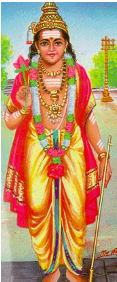
காமனைத் தகனம் செய்தார் கதிர்வேலன் உதிக்க வைத்தார்

பிரம்மமாய் எழுந்து நின்றார் பெரும்விஷம் எடுத்து நின்றார் அப்பெரும் அரனார் அருகில் அணுகிடும் தொண்டர் ஆகி நிற்கின்ற பெருமை பெற்றார் நினைப்பதில் களங்கமுற்றார்