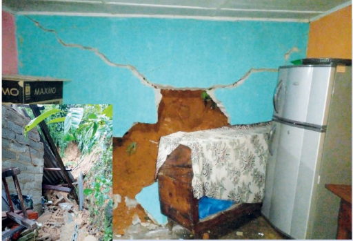
ஹட்டன் காலியி புர பகுதியில் ஏற்பட்ட மண்சரிவு மற்றும் வெள்ளம் காரணமாக வீடுகள் பகுதியளவில் சேதமடைந்துள்ளன. (மதுரா கத்தசெல்லறேவா)