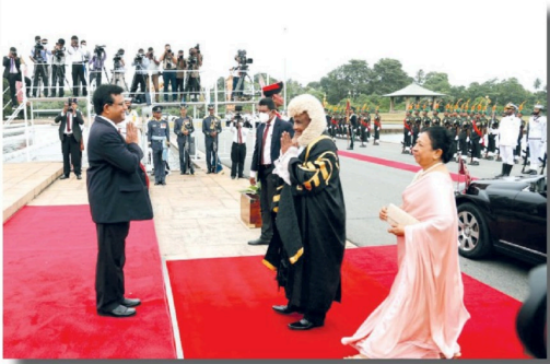
(7ஆம் பக்கத் தொடர்ச்சி...)

சவாக்களுக்கு முகங்கொடுக்கின்றன. தொழிலகக் கிவ்வழியெய்து, கூட்டுக் காலங்களில் வெளிநாட்டு ஊழியர்கள் இவர்களுக்கு அனுப்பும் நிதிபின் அளவு குறைந்துவிட்டது. அதற்குப் பல காரணங்கள் உள்ளன. கொள்கை நெறங்க காரணமாக பல தொழில்கள் இவ்வாறுபோயின. தொழில்களுக்கு வெளிநாட்டு செலவோடு குறைந்துள்ளன. ரூபவின் பெறுமதியைச் செயற்கையாகக் கட்டுப்படுத்தியதற்கு காரணமாக வேறு முறைகளின் மூலம் இவர்களுக்கு பணம் அனுப்பும் மிகவும் இயலாமலானது. தற்போது படிப்படியாக இந்தநிலைமை மாற்றமுடைய வருகின்றது. வங்கி முறைமைமீட்டாக இவர்களுக்குப் பணம் அனுப்புகளை வகைக்குளிப்பதற்கு நாம் நடவடிக்கை எடுப்போம். ஒவ்வொரு மாதத்திலும் தேவையான பணங்களைச் சரிசெய்து கொடுக்கிறோம். இச்சரிசும் பயனிலான அதிகாரிகள் வருகின்றனவேனவற்றற்கு தேவையான