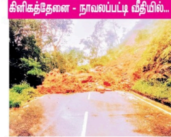
கிளிசுத்தேனை - நாவல்பட்டி வீதியில்...