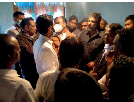
இதுவரையில் மீட்கப்பட்டுள்ளதுடன், ஏனைய இருவரையும் தேடும் பணிக்காக மேலதிக இராணுவத்தினரையும், அதிரடிப்படையினரையும் மீட்பு பணியில் ஈடுபடுத்துமாறு ஜீவன் தொண்டமான் அதிகாரிகளுக்கு வேண்டுகோள் விடுத்துள்ளார்.

■ ஆரமலன் கெட்டபுலா, அக்கரவத்த தோட்டத்தில் ஆற்று வெள்ளத்தால் அடித்துச் செல்லப்பட்டு உயிரிழந்தவர்களை மீட்க மேலதிக படைகளை களத்தில் இறக்க வேண்டுமென சம்பந்தப்பட்டவர்களுக்கு பாராளுமன்ற உறுப்பினர் ஜீவன் தொண்டமான் வேண்டுகோள் விடுத்துள்ளார். குறித்த அளர்த்தத்தில் பாதிக்கப்பட்ட மூன்று குடும்பங்களையும் நேற்று (4) சந்தித்த ஜீவன் தொண்டமான், தனது அனுதாபங்களை தெரிவித்துள்ளதுடன், அந்த குடும்பங்களுக்கு நிதியுதவியும் வழங்கி வைத்தார். இவ்வாறு நீரில் அடித்துச் செல்லப்பட்டு காணாமல் போன மூவரில் ஆண் ஒருவரின் சடலம் மாத்திமே