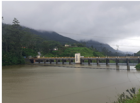
எனவே, காசலரி நீர்தேக்க தாழ் நிலப் பகுதிகளில் வசிப்பவர்கள், மிகுந்த அவதானத்துடன் இருக்குமாறு மின்சார சபையினர் வேண்டுகோள் விடுக்கின்றனர்.