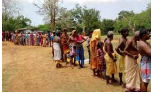
(காரைத்வ நிருபர் சகா)

கதிர்காமகாட்டு பாதையில் இறுதி கட்ட நுழைவாயில் இருக்கின்ற கட்டகாமத்தில் இலங்கை ராணுவத்தினர் பாத யாத்திரிகர்களுக்கு தொடர்ச்சியாக அன்னதானம் வழங்கி வருகின்றார்கள். ஆயிரக்கணக்கான