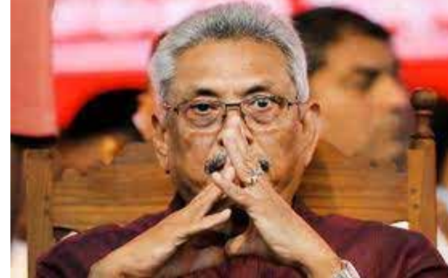
முன்னாள் ஜனாதிபதி கோட்டாபய ராஜபக்ஷ எதிர்வரும் 11ஆம் திகதி நாடு திரும்புவதற்கான தகவல்கள் வெளியாகியுள்ளன. நாடு திரும்பும் கோட்டாபய, சிறிது

காலத்தின் பின்னர் மீண்டும் தீவிர அரசியலுக்குள் வருவதா, இல்லையா என்பது குறித்து அவரது நெருங்கிய தரப்புகளுடன் கலந்துரையாடவுள்ளதாகவும் தகவல்கள் வெளியாகியுள்ளன. தற்போது சிங்கப்பூரில் தங்கியுள்ள கோட்டாபயவுக்கு எதிர்வரும் 11ஆம் திகதி வரை அந்நாட்டில் தங்கியிருக்க சிங்கப்பூர் அரசாங்கம் அனுமதி வழங்கியுள்ளது. அதன் பின்னர் அவர் இலங்கை திரும்புவார் என எதிர்பார்க்கப்படுகிறது. அதேவேளை கோட்டாபய நாடு திரும்பியவுடன், மிரிஹானவில் உள்ள அவரது தனிப்பட்ட இல்லத்திற்குத் திரும்புவார் எனவும் தகவல் வெளியாகியுள்ளது. இதேவேளை, கோட்டாபய மீண்டும் நாடு திரும்புவதற்கான சரியான நேரம் இதுவல்ல என, ஜனாதிபதி ரணில் விக்ரமசிங்க தெரிவித்திருந்தமையும் குறிப்பிடத்தக்கது.