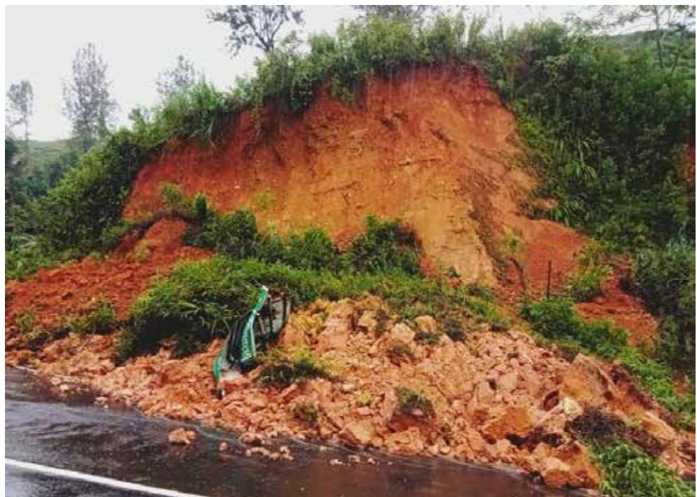
மலையகத்தில் அதிக மழையுடனான வானிலை காரணமாக அட்டன் நுவரெலியா பிரதான வீதியில் பத்தனை சந்தியில் மண்மேடு சரிந்து விழுந்தமையால் குறித்த வீதி பகுதியளவில் பாதிக்கப்பட்டுள்ளது.