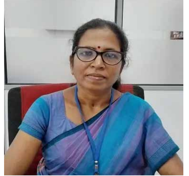
முடியும் எனவும் தெரிவிக்கப்பட்டுள்ளது.

இதில் அபிவிருத்தி திட்டமிடல் அனுமதி தொடர்பாக துறை சார்ந்த திணைக்களங்களின் தலைவர்களின் பங்குபற்றுவதோடு இந்த பொதுமக்கள் நடமாடும் சேவை நடத்தத் தீர்மானிக்கப்பட்டுள்ளது. எனவே மேற்படி நடமாடும் சேவையில் பயன்பெற விரும்பும் பொதுமக்கள் குறித்த நடமாடும் சேவையில் பங்குபற்ற