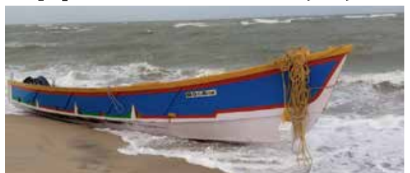
(ந.லோகதயாளன்) யாழ்ப்பாணம், ஓக. 07

இந்தியாவின் மண்டபம் பகுதி பதிவில் இருந்த தூத்துக்குடி படகு ஒன்று புத்தளம் கடற்கரையில்