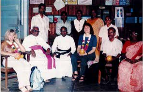
1999ஆம் ஆண்டு புனித வளனார் கத்தோலிக்க அச்சகத்தை கட்டுவது தொடர்பான கலந்துரையா டல் ஜேர்மன் நாட்டு தேவையில் இருக்கும் ஆலயத்திற்கு உதவி என்ற அமைப்பினருடன் நடைபெற்றபோது கத்தோலிக்க அச்சக வளாகத்தில்.....