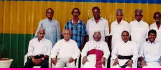
2003ஆம் ஆண்டு புனித வளனார் கத்தோலிக்க அச்சகத்தை ஆயர் திறந்து வைத்த பின்னர் கட்டடக் குழுவினருடன் எடுக்கப்பட்ட படம்.

யும் அறிந்து எதுவுமே தெரியாதவர் போல் இருப்பவர். தெரிந்த விடயங்களையும் மற்றவர்கள் சொல்லும் போது கூட புதிதாகக் கேட்பது போல் உணர்வோடும் உணர்ச்சியோடும் செவிமடுக்கக் கூடியவர்.