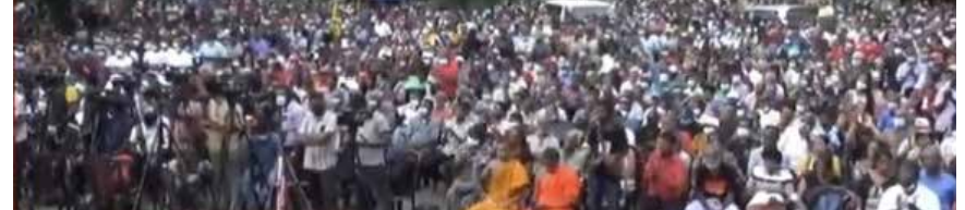
போராட்டக்கார்களுக்கு எதிரான டியாக் நிறுத்த வேண்டும் என வலியுறுத்தி அடக்குமுறைகளை அரசாங்கம் உடன காலிமுகத்திடல் போராட்டம்