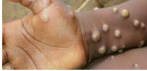
தொற்றுக்குள்ளான எவரும் அடையாளம் காணப்படவில்லை எனவும் அவர் குறிப்பிட்டுள்ளார்.