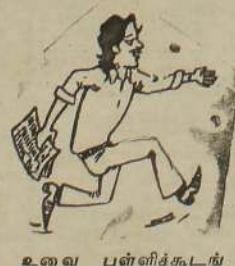
உவை பள்ளிக்கூடங் களை மூடி, பாடசாலை நடத்தாம விட்டு, கு நைனா வலு ஈசியான எல்லாம் பேப்பரை செட் பண்ணி, எக்ஸாமை ஒப்பேத்தப் பாக்கினம் போல...

யாழ்ப்பாணம் அக் 18 ஆரம்ப ஆசிரியர்களுக்கு கான நியமனக் கடிதங் களை நேற்று பெற்றுக் கொள்ளத்தவறியவர்கள் எதிரவரும் சனி்கிழமை அவற்றைப் பெற்றுக் கொள்ள முடியும்.