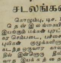
அப்ப ரிசேர்வுக்கு ஒரு ரிசேர்வ் எண்டு சொல்லுங்கோ!