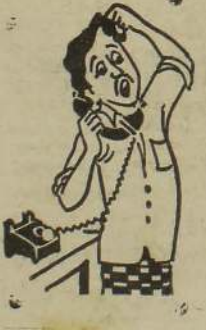
அப்ப ரிசேர்வுக்கு ஒரு ரிசேர்வ் எண்டு சொல்லுங்கோ!

யாழ்ப்பாணம், டிசம்பர் 11 கொழும்பு - யாழ்ப்பாண சேவைகள் நேற்றும் வழமை போல் நடைபெற்றன. பெரும் எண்ணிக்கையான பயணிகள் நேற்று யாழ்ப்பாணத்தில் இருந்து கொழும்பு சென்றதையும் அவதானிக்க முடிந்தது. (9-10)