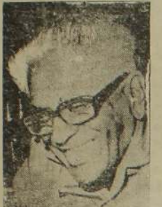
கட்சித் தலைவர் கலாநிதி கொலின்ஸ்

தமிழ் மொழியை உத்தியோக மொழியாக தாமதமின்றி சட்டமாக்க வேண்டும், தமிழ் எதிர்ப்புக்கான அடிப்படைக் காரணம் மொழிப் பிரச்சினைதான்.