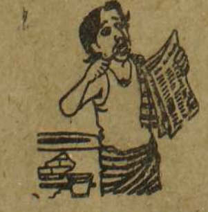
பழுதாய் போன சரக்கைச் செலுத்த இது தான் சரியான இடம் என்ற நினைப்புப் போல!

கொழும்பு, ஏப். 30 வவுனியா மாவட்டத்தில் அமுல் செய்யப்பட்டு வந்த ஊரடங்குச் சட்டம் நேற்று மாலை 6 மணியுடன் நீக்கப்பட்டு விட்டதாகக் கட்டுப்பாட்டுகளை தலைமை அலுவலகம் அறிவித்திருக்கிறது. எனினும் - மன்னார் தீவு தவிர்ந்த மன்னார் மாவட்டத்தில் ஊரடங்கு தொடர்ந்து அமுல் செய்யப்படுவதாக அறிவிக்கப்பட்டுள்ளது. [இ-ஏ]