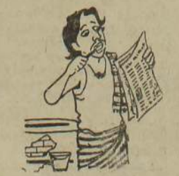
ஏஜன்சிக்காரர் வந்திட்ட தலை இனிமேல் முத்திரைக்குத் தட்டுப்பாடு இருக்காது என்று சொல்லுகிறார்.....!

யாழ்ப்பாணம், மார்ச் 10 பண்ணைப் பாலத்தடியில் பயணிகளை சோதனையிடும் நடவடிக்கையில் நேற்று ஸ்ரீலங்காப் பொலீஸார் ஈடுபடுத்தப்பட்டனர். பயணிகள் மொழிப்பிரச்சனை முச்சந்தி முரளி முகவர் தபால் நிலையம் யாழ்ப்பாணம் மார்ச் 10 யாழ்ப்பாணத்தில் முதலாவது முகவர் தபால் நிலையம் ஒன்று திறக்கப்படும். யாழ்ப்பாணம் 10 மணிக்கு தபால் அத்தியட்சகர் பிரஸ் தபால் முகவர் தபால் நிலையத்தை திறந்து வைப்பார். அரசு தபால் நிலையங்களில் உள்ள சகல சேவைகளும் இங்கு விடுமுறை நாட்களிலும் நடைபெறும். (அ)