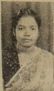
பொன்மலர் யோசெப்பின் யோசேப்