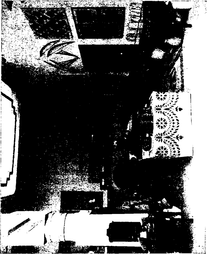
கொத்தவேலை செய்த மாச்சாமான்கள் முதலியன

சீக்கிரத்தில் விலையாயின. ஜமூக்காளங்களிலுள்ள பல வர்ணக்களையும் வேலைப்பாடு முதலியவற்றையுங் கண்டு, கைத்தொழிலில் இத்தியாதேசத்தவர்களுக்குள்ள சாமர்த்தியத்தை வியக்காதார் யாருமில்லை. சென்னைச் சித்திரவேலை வித்தியாசாலையார் அனுப்பின பலவிதமான கொத்தவேலை செய்த மாச்சாமான்களும், பிசின்வேலை செய்த பொன்னிறமான தட்டுகள், பெட்டிகள் முதலியனவும் மற்றைய