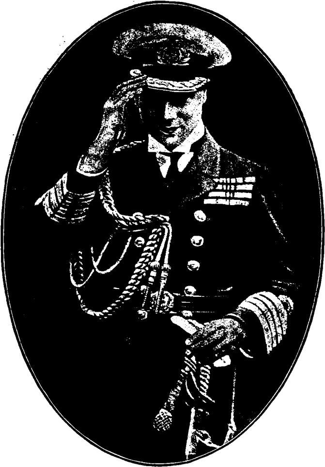
பிரின்ஸ் ஆப் வேல்ஸ்.