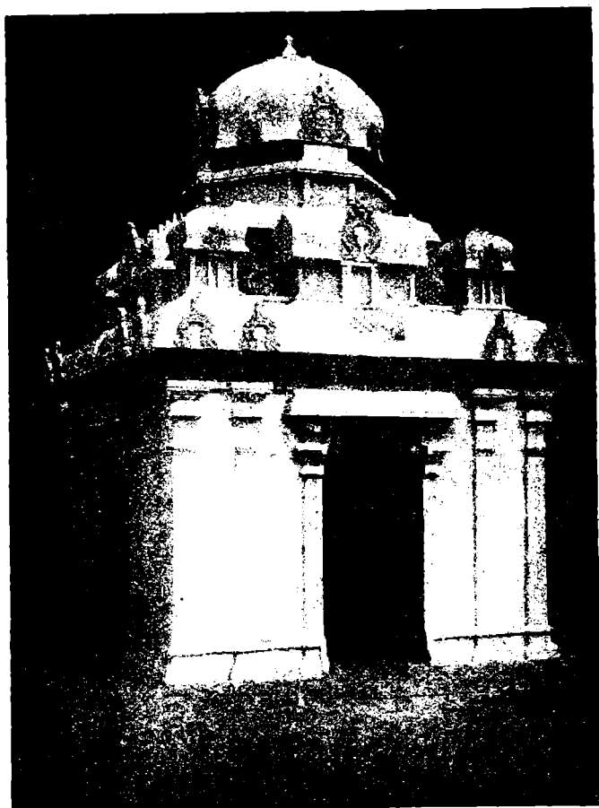
தஞ்சாவூர் பிரகஸ்திஸ்வரர் ஆலயத்தா மாநிரி.