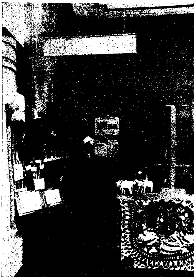
சென்னை, விவசாய இலாகா