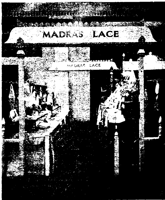
சென்னை லேஸ் நிழைகள்.