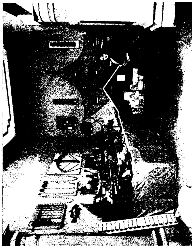
மச்சலகைகள் சம்பந்தமான காட்டுப்பொருட்கள்

மச்ச இலாகாவரால் ஆங்கு ஏற்படுத்தப்பட்ட கலையில், மீன் பிடிக்கும் பொறிகள், வலைகள், படவுகள் முதலியவற்றை விளக்கும் மாதிரிகளும், மீன்களைக் கருவாடாகச் செய்யும் சாலையின் விபரங்களைக் காண்பிக்கும் மாதிரியும், மீன்களைக் கொண்டிப்போவதற்கேற்ற கூடைகளும், நண்டுகளைக்கொண்டு செல்வதற்கேற்ற குடம்