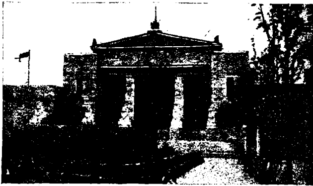
பிரித்தானிய ராஜாங்க மாளிகை.

பிரித்தானிய ராஜாங்க மாளிகை. இங்கிலாந்து ஆங்கிலேய ஏகாதிபத்தியத்தின் தாய்நாடாதலின் அத்தேசத்தவராகிய ஆங்கிலே யர் தங்கள் ராஜ்ஜியமுறை, ராஜ்ஜிய பாதகாப்புக்கு வேண்டிய சாத னங்கள் வர்த்தகச்சிறப்பு, விளை பொருள், கைத்தொழிற்பொருள் முத