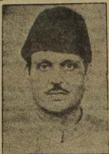
வி. பி. சிங்

இந்தியாவில் தற்போது உருவாகியுள்ள அரசியல்