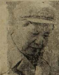
மா - ஸே - துங்

சீனாவின் மரணச் சடங்கு களுக்காக கூடிய மாணவர் களை பின்பு ஆர்ப்பாட்டத்தில் இறங்கினர். இன்னும் ஆர்ப்பாட்டம் செய்து வருகின்றனர். கவசாரசு புரட்சியின் இறுதிச் சட்டத்தில் சீனா எப்படிக்காணப்பட்டதோ அதே போன்றே தற்போது காணப்படுவதாகத் தெரிவிக்கப்படுகிறது. சீனாவின் மரணச் சடங்கு களுக்காக கூடிய மாணவர் களை பின்பு ஆர்ப்பாட்டத்தில் இறங்கினர். இன்னும் ஆர்ப்பாட்டம் செய்து வருகின்றனர். கவசாரசு புரட்சியின் இறுதிச் சட்டத்தில் சீனா எப்படிக்காணப்பட்டதோ அதே போன்றே தற்போது காணப்படுவதாகத் தெரிவிக்கப்படுகிறது.