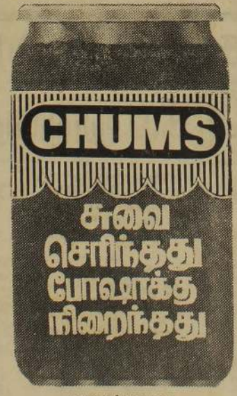
மதுரச் சுவை குடும்பத்தவரைக் களிப்பூட்டும்