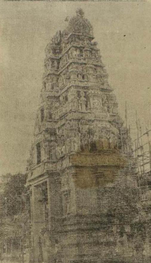
துர்க்கை அம்மன் ஆலய முகப்புத் தோற்றம்

வசையில் பாண்டியனும் பட்டர் பிரானும் கருத்தொருமித்துப் பாடியருளிய பாண்டியன் பல ஓரே தொடராக உள்ளன. "வலிய வந்தென் தலைக் சேய் பதம் வைத்த தண்ணளியாய்" என்று பாண்டியனார் பாடியதைப் பட்டர் பிரான், "நின்பாதம் என்றும் வாசக்கமலம் தலைமேல் வலிய வைத்து ஆண்டு" என்று பாடியருளுவர் இவ்வாறே "கரும்புங் சணை" ந்தும் பா பா ந்குசமுங்கொண்டு அடியேன் திரும்புந் திசை தொறும் தோற்று கண்டாய்" என்பது "பார்க்குந் திசை தொறும் பாசாங்குசும், பனிச்சிறை வண்டு, ஆர்க்கும்