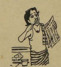
அப்ப பின்னை பின்னையள் பாடு கொண்டாட்டம் தான் என்று சொல்லுங்கோ.....!

வடக்கு-கிழக்கு மாகாணத்தில் வாழும் தமிழ்ப்பேசும் மக்களின் பாதுகாப்பு ஒப்பந்தத்தைக் காத்திருக்க இரண்டு வருடங்களாகியும் இன்றுவரை உறுதிப்படுத்தப்படவில்லை. இந்நிலையில் அமைதிப்படை வெளியேற ஆரம்பித்திருப்பது எதிர்காலத்தில் தமிழ் பேசும் மக்கள் முற்றிலும் பாதுகாப்பற்ற நிலைமைக்குத் தள்ளப்படுவதன் ஆரம்பமாகவே (8 ஆம் பக்கம் பார்க்க)