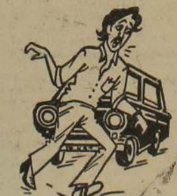
எங்கையும் நல்லதைக் கெடுக்கிற கோடாரிக்காம்புகள் இருப்பின்தான் போலீஸ்...