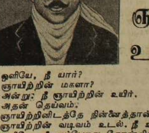
ஒளியே, நீ யார்?

ஆனால் இவர் குண்ப்புவுடன் தொடர்பு ஏற்படுத்திக் கொண்டு உடற்பயிற்சிக் கலையை சேர்த்து பயிற்றுவிக்கத்தொடங்கினார்.