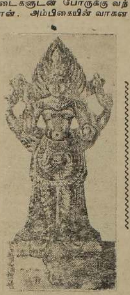
மாமிய சிங்கமே அகரசைலியங்கள் அனைத்தையும் மக்களுக்காகச் செய்து கொடுத்தாள். அவ்வசரணும் அழித்து விட்டது. அகரன் மகிஷ உருவில் வந்தபோது அவன் செருக்கை அடக்கி,

நம் நாட்டில் தேவி வழிபாடு மிகச் சிறந்து காணப்படுகின்றது. அம்பிகையின் உருவ பேதங்கள் பல. அவற்றை அமைத்துக் கொண்டு வேறு வேறு நிலையில் வைத்து வழிபடுவோர் பலர். ஆயும் அறிவும் கடந்த அரணுக்குத் தாயும் மகளும் தாரமுமாக விளங்குபவள் அம்பிகை. இவளே சகல ஆற்றல் களுக்கும் இருப்பிடமாயவள். அமைதியான வாழ்வையும் அளவில்லாத ஆனந்தத்தையும் அருளும் அன்னையாக மிளர்கின்றாள். இவளை உபாசித்துப் பெரும் புண்ணியம் பெற்றோர் பலர். எவனுக்கு மறுபிறவி என்று ஒன்று இல்லையோ அவனே அம்பிகையை உபாசிக்கும் பாக்கியம் பெற்றவனாவான்.