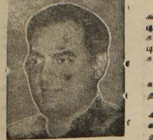
ராஜீவ் காந்தி பதவி செல்ல முடியாது; இந்திரா காங்கிரஸுடன் தேர்தல் கூட்டோ, தொகுதி

அமைச்சர் பதவியை ஏற்குமா? என்ற கேள்விக்கு நாளை