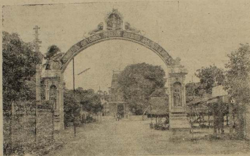
தெல்லிப்பனை ஸ்ரீ தூர்க்காதேவி தேவஸ்தான முகப்புத் தோற்றம்

'உன்னால் சாதிக்க முடியாத, உனது முயற்சியால் ஓடிக்க முடியாத பாசனிலங் கினை ஓடிக்க, இன்று இச்சிறையில் அடைத்து நானே வழிப் படுத்தி விட்டேன்' என்று