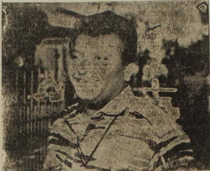
அணைந்துவிடாத பாதுகாப்பது ஆசிரிய சமூகத்தின் தலையாய பொறுப்பாகும். அததுடன் எமது சமுதாயத்தின் கிடிவை இடைவிடாமல் கொண்டு முன்னெடுக்கப்படும் தேசிய விடுதலைப் போராட்டத்துக்கு உறுதுணையாக நிற்பது கவிஞர்களின் கடமையாகும். எத்தனையோ இடர்களை

உலகெங்கும் ஆசிரியர் சமூகத்தைப் பாராட்டும் நான்கு ஒக்ரோபர் 6 ஆம் நாள் உலக ஆசிரியர் நாளாகக் கொண்டாடப்பட்டு வருகிறது. உலக சமுதாயம் நன்றியுணர்வுடன் கொண்டாடியும் இந்நன்னைகளில் நாமும் எமது ஆசிரியர் சமூகத்தைப் பாராட்டிக் கொள்கிற்பது சால்சிறந்ததாகும்.