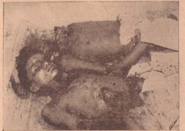
தலை துண்டிக்கப்பட்ட நிலையிலும் வயிறு சிளந்த நிலையிலும் பலியான இரு சகோதரர்கள்.

மக்கள் பல? கூடி நின்ற கிணற்றடிக்குச் சமீபமாக அந்த குண்டு விழுந்த வெடித்தது. ஒரிசு நிமிடங்களில் நடந்த அனர்த்தத்தினால், பத்துப் (5 ஆம் பக்கம் பார்க்க)