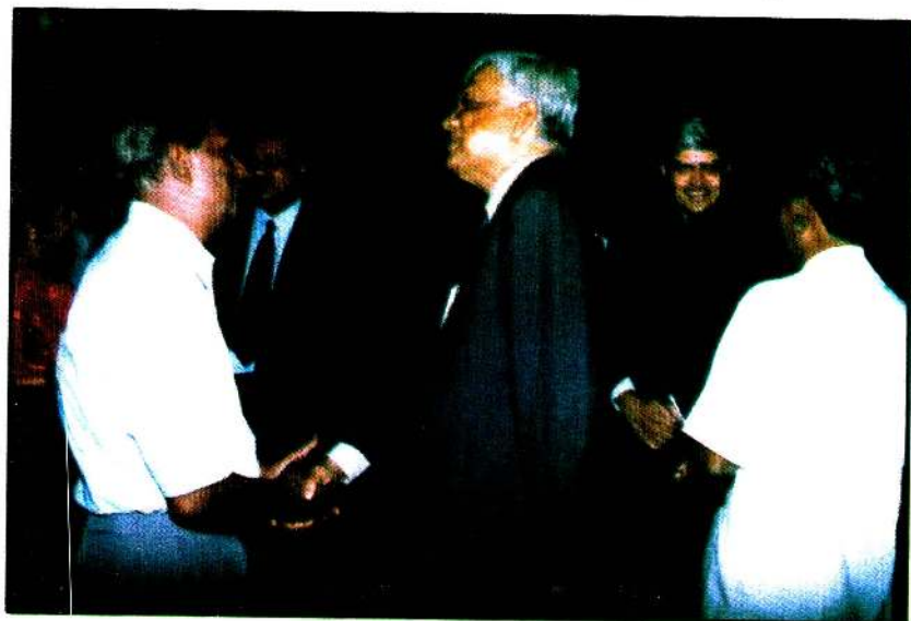
அரசு உயர் அமைச்சர்களுடன்