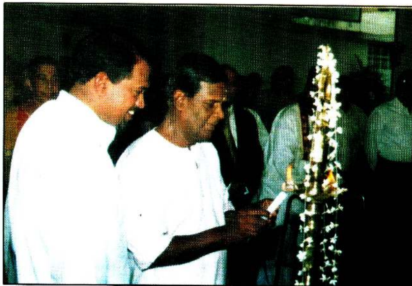
கொழும்புத் தமிழ்ச் சங்கத்தில்