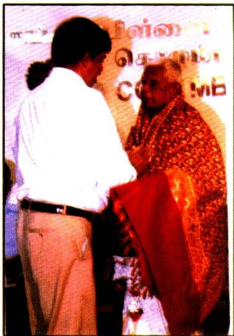
கொழும்புத் தமிழ்ச் சங்கத்தில்