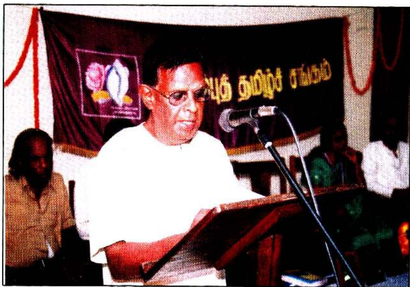
கொழும்புத் தமிழ்ச் சங்கத்தில்