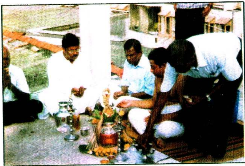
கொழுபுத் தமிழ்ச்சங்க அடிக்கல் நாட்டுவிழா வைபத்தின் போது