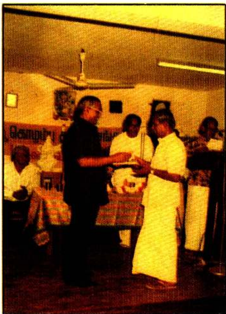
கொழும்புத் தமிழ்ச் சங்கத்தின் முன்னாள் அமைச்சருடன்