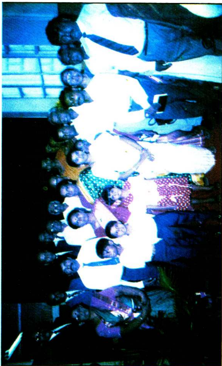
22.5.94இல் பிரதம தபாலகத்தில் நடைபெற்ற முத்திரை வெளியீட்டு விழாவின் போது