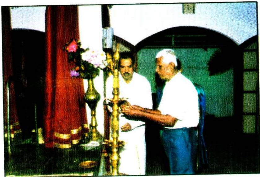
கொழுபுத் தமிழ்ச் சங்கத்தின் இந்நாள் பொதுச் செயலாளருடன்