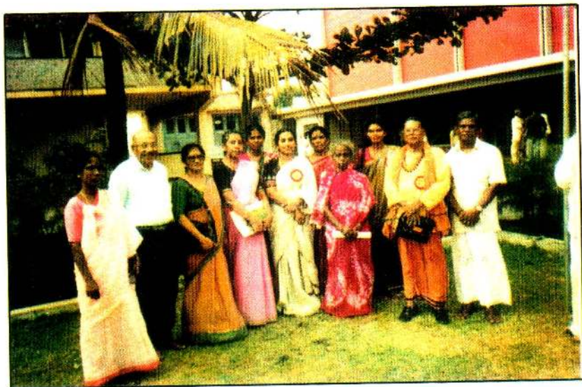
கொழும்பு இராமகிருஷ்ண மிஷன் மண்டபத்தில்