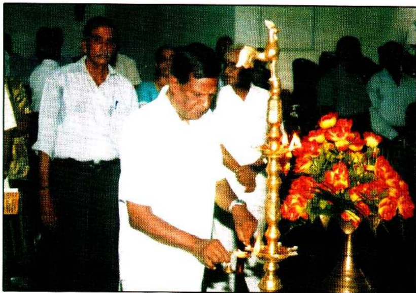
25.1.2004 ஞாயிறு கொழும்புத் தமிழ்ச்சங்கத்தில் சுகவாழ்க்கை -பாகம் 2 நூல் வெளியீட்டின்போது