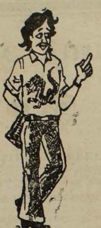
செய்தி சுத்த அபத்தம் என்கிறது இந்தியா

அமைச்சர் தொண்டா விளக்குவார் கொழும்பு, மே 25 அமைச்சர் தொண்டா விளக்குவார்.