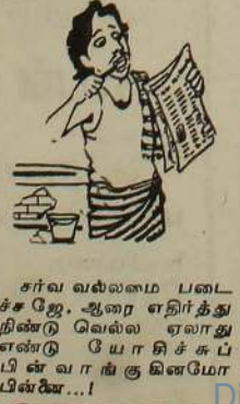
சர்வ வல்லமை படைச்சேஜே. ஆரை எதிர்த்து நின்று வெல்ல ஏலாது என்று யோசிச்சுப் பின் வாங்குகின்றோம் பின்னை...

யாழ்ப்பாணம், ஆக. 16 தடுப்புக்காவலில் வைக்கப்பட்டிருந்த பின்னர் விடுவிக்கப்பட்ட 288 இளைஞர்களும், 6 யுவதிகளும் நேற்று வடக்கே வந்து சேர்ந்தனர். காவல்துறை முகத்திடு விடுவிக்கப்பட்ட 281 பேரும், பூலா முகாமி