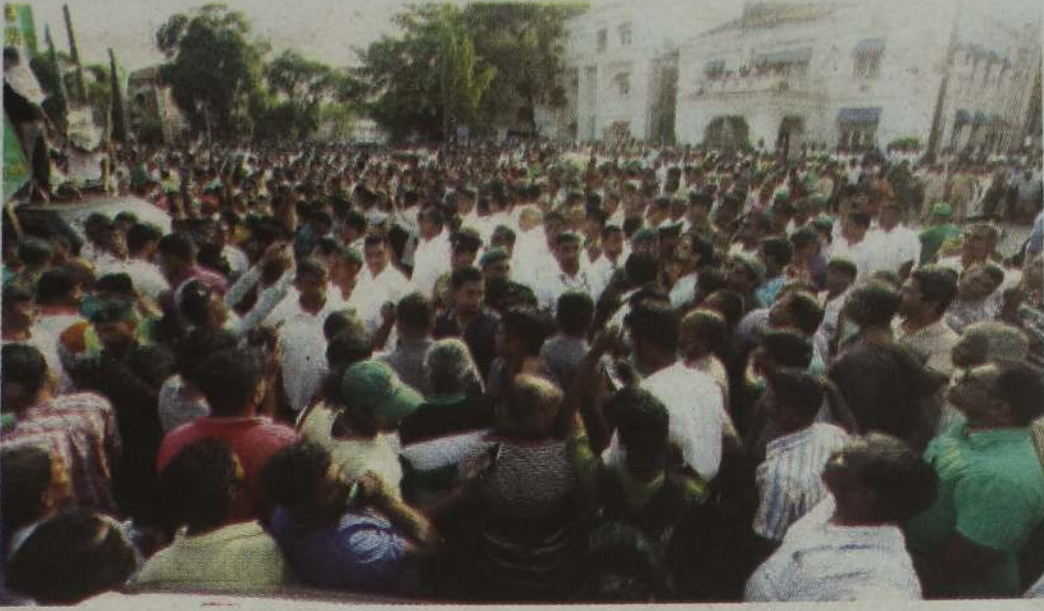
அரசுக்கு ஆதரவான ஐக்கிய தேசியக் கட்சியின் ஆர்ப்பாட்டம் நேற்று முன் தினம் கொழும்பில் நடைபெற்றது. ஆயிரக்கணக்கானோர் கலந்துகொண்ட இந்த ஆர்ப்பாட்டத்தில் பிரதமர் ரணிலும் பங்கேற்றார். (கு)