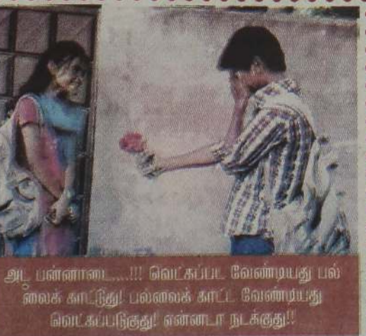
அட பன்னாண்ட...!!! வெட்கப்பட வேண்டியது பல்லைக் காட்டுது! பல்லைக் காட்ட வேண்டியது வெட்கப்படுது! என்னடா நடக்குது!!