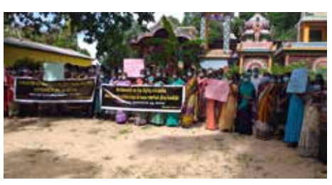
(காரைதீவு நிருபர் சகா)

வடக்கு கிழக்கு ஒருங்கிணைப்பு குழுவின் ஏற்பாட்டில் நடைபெறுகின்ற