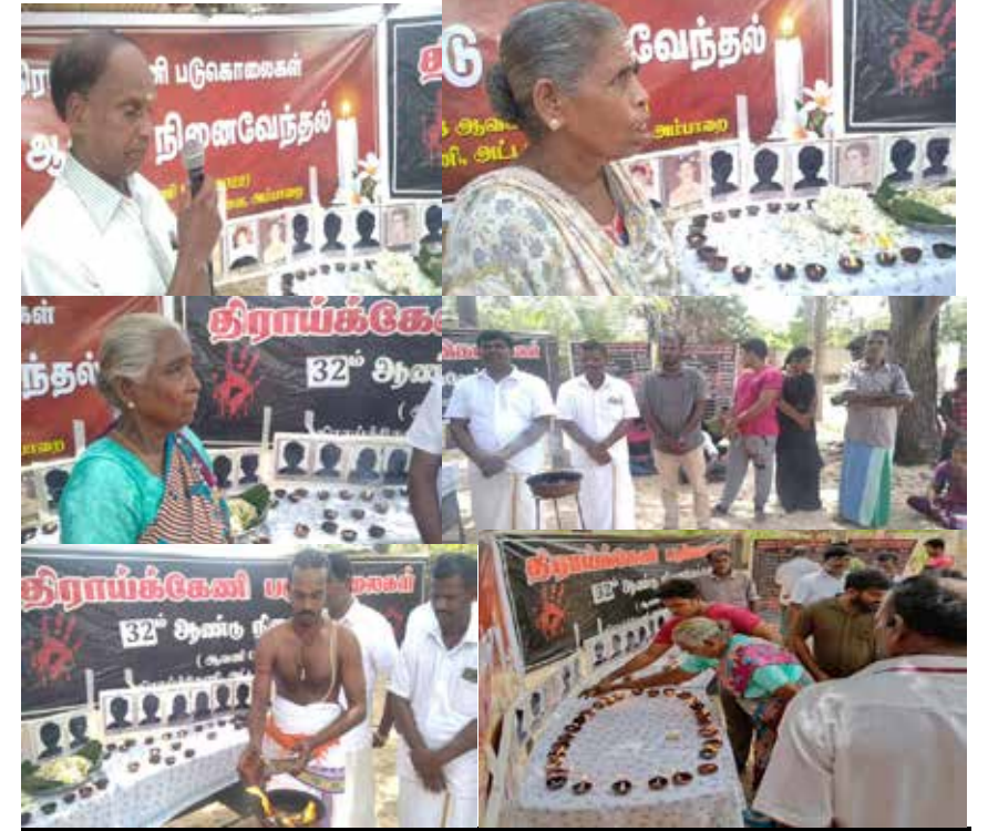
திராய்க்கேணி படுகொலை சம்பவத்தின் 32 வது வருட நினைவேந்தல் நிகழ்வு, சம்பவம் இடம்பெற்ற திராய்க்கேணி ஸ்ரீ முத்துமாரியம்மன் ஆலயத்தில் நடைபெற்ற போது..