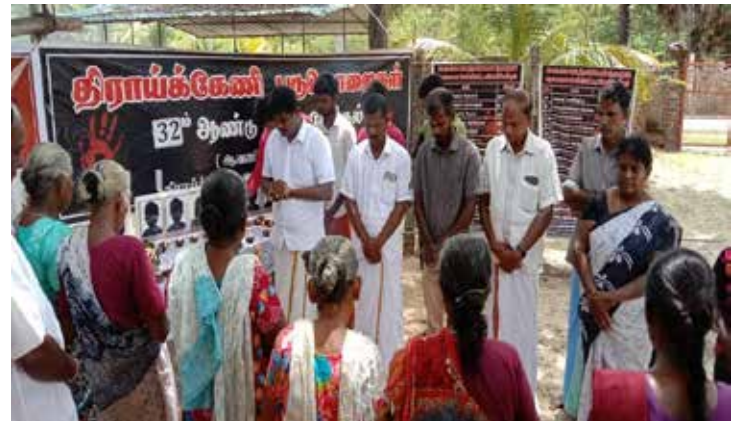
திராய்க்கேணி படுகொலை நான் நினைவு நிகழ்வு

இலங்கைக்கான 51 மில்லியன் அமெரிக்க டொலர் கடனை சீனா அரசுக்கு சொந்தமான எக்ஸிம் வங்கி நிறுத்தி வைத்துள்ளது. மத்திய அதிவேக நெடுஞ்சாலையின் முதல் கட்ட கட்டுமானத்திற்கு தேவையான கடனுவழியே நிறுத்தி வைக்கப்பட்டுள்ளதாக தெரிவிக்கப்பட்டுள்ளது. இந்த கடன் நிறுத்தப்பட்டமையை அடுத்து கடவத்தைக்கும் மீரிகமவுக்கும் இடையிலான 37 கிலோமீற்றர் தூரத்தை உள்ளடக்கிய திட்டத்தில் பணிபுரிந்த சுமார் 5000 சீனர்கள், அங்கிருந்து வெளியேறி வருகின்றனர். அத்துடன் இந்த கடன் நிறுத்தல் காரணமாக சுமார் 2000 இலங்கையர்களின் தொழில்களும் ஆபத்துக்கு உள்ளாகியுள்ளன. இலங்கையின் பொருளாதார நெருக்கடி மற்றும் வெளிநாட்டுக் கடனைத் திருப்பிச் செலுத்துவதை இலங்கை நிறுத்தியுள்ளமை ஆகியவற்றை கருத்திற்கொண்டே இலங்கை அரசாங்கத்தின் சீனாவின் எக்ஸிம் வங்கி கடனை இடைநிறுத்தியுள்ளது.