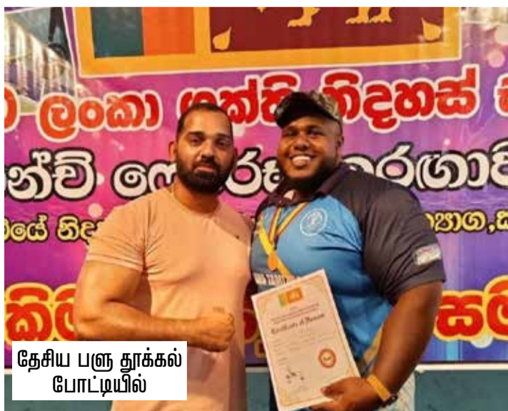
தேசிய பளு தூக்கல் போட்டியில்

தேசிய ரீதியான பளு தூக்கல் போட்டியில் யாழ்ப்பாணம், தென்மராட்சி பிரதேசத்தைச் சேர்ந்த