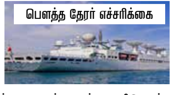
பெளத்த தேரர் எச்சரிக்கை

சீனாவின் உளவுக் கப்பலை அம்பாந்தோட்டை துறைமுகத்தில் நங்கூரமிட அனுமதிக்கும் நடவடிக்கைகளுக்கு முன்னணி பெளத்த பிக்கு ஒருவர் கண்டனம் தெரிவித்துள்ளார்.