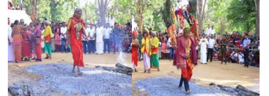
வரலாற்று பிரசித்தி பெற்ற கதிர்காமம் கந்தன் ஆலய ஆடி வேல்விழாவை ஒட்டி வள்ளியம்பாள ஆலயம் முன்றலில் நேற்று(8) திங்கட்கிழமை காலை தீமதிப்பு இடம்பெற்ற போது...

நெச்சிமுனை ஸ்ரீ பேச்சியம்மன் ஆலய வருடாந்த உற்சவம் கடந்த (31) திகதி திருக்கத்தவு திறத்தலுடன் ஆரம்பமாகியது. தொடர்ந்து 8 நாட்கள் சிறப்பான முறையில் உற்சவங்கள் நடைபெற்றது. பக்தர்கள் மடிப்பிச்சை எடுத்தல் மற்றும்