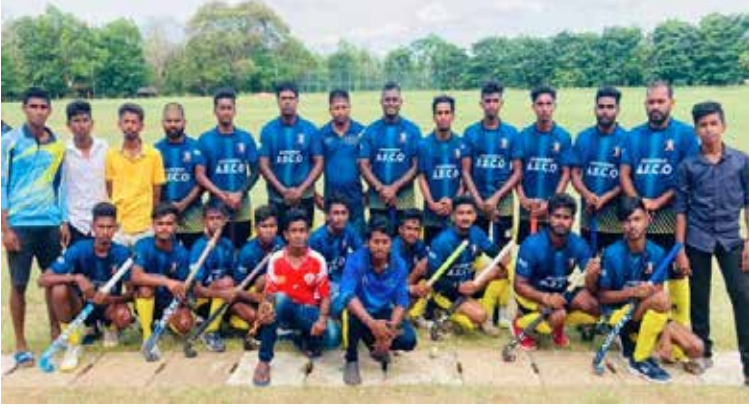
(காரைதீவு நிரும் சகா)

கிழக்கு மாகாண ஹொக்கி அணிகளுக்கிடையிலான போட்டியில் அம்பாறை மாவட்ட அணியான காரைதீவு ஹொக்கி லயன்ஸ் அணி 8-7 என்ற கோல்களால் வெற்றிவாகை சூடி